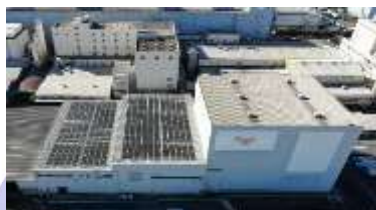
船橋工場、RD&Eセンター