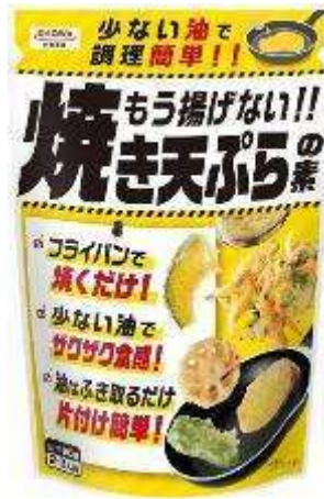
『もう揚げない!!焼き天ぷらの素』の作り方