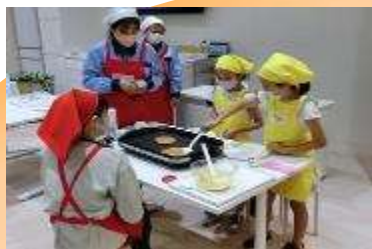
船橋プレミックス第2工場