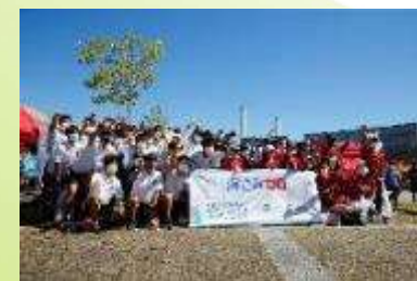
いわきFC～海ごみゼロ DAY～

石油由来プラスチックの使用量を約20%削減したバイオマスゴミ袋「大地のMino-Re:」を発売し、J2いわきFC(ビジネスパートナー)のホーム試合～海ごみゼロ DAY～で開催したイベント「ごみ拾いウォーキング」にて提供しました。