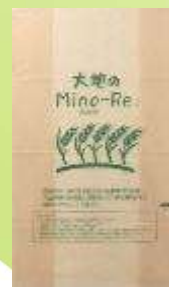
「大地のMino-Re:」 (だいちのみのり)