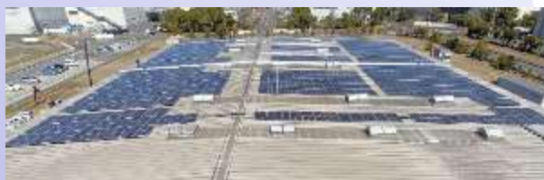
鹿島工場(潮来ミックス分工場)

PPA モデル(※)による太陽光発電設備を設置し、使用電力を実質 100%再生可能エネルギーとしました。