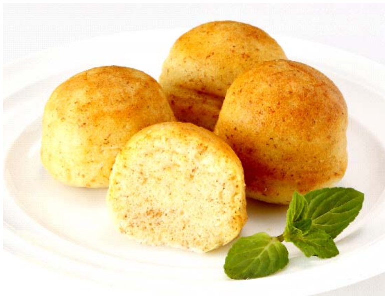
3. モーニングプチパンケーキ（全粒粉入り）