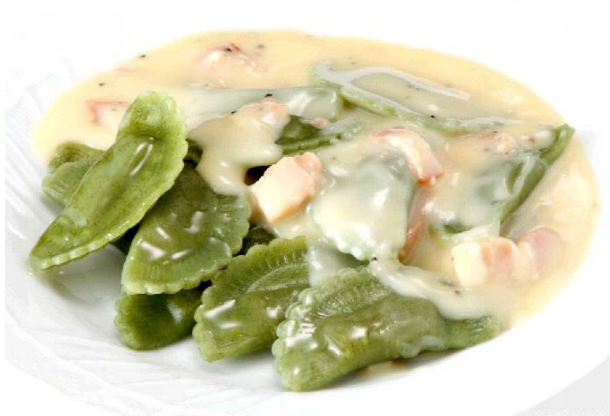
1.ほうれん草ラビオリ