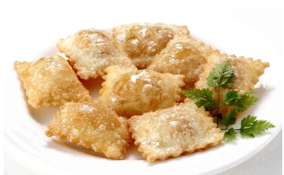
2. ひとくちピリ辛中華パイ