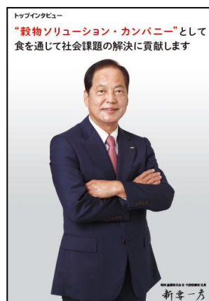
(トップインタビュー)